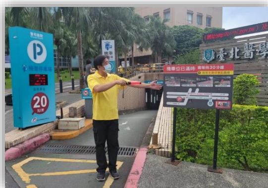
人員於入口處引導