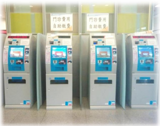
增設自助繳費機及升級系統